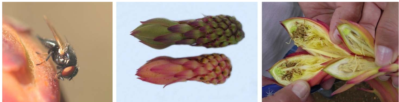
Figura 2. Izquierda. Hembra adulta de Dasiops saltans . Centro. Botón floral sano (arriba) y botón afectado por D. saltans (abajo). Nótese color rojizo del botón floral afectado. C. Disección de botones florales. Nótese daño interno de las anteras causado por la alimentación de larvas de D. saltans .