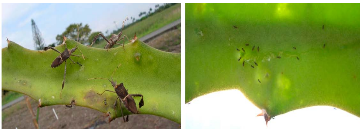
Figura 3. Leptoglossus zonatus (Dallas) sobre penca de pitaya amarilla. Derecha. Clorosis en cladodios de pitaya amarilla causado por L. zonatus . Nótese las hormigas atraídas a los exudados de las heridas.